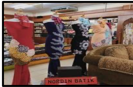
Gambar 1: Pameran batik di dalam Showroom